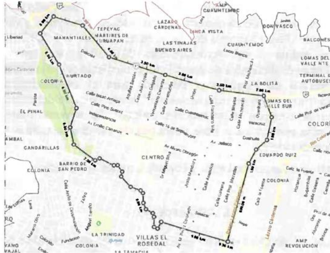
Imagen. Ámbito de aplicación del ACUERDO